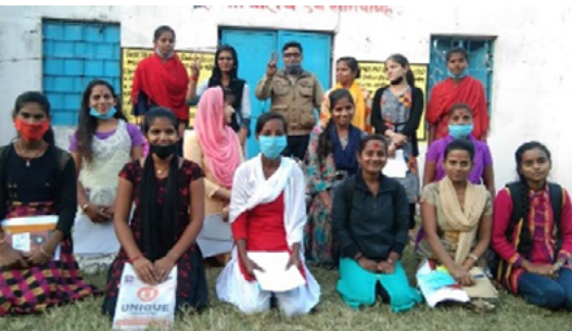
Figure 3 : Jeunes chercheurs avec le coordinateur national d'Inde