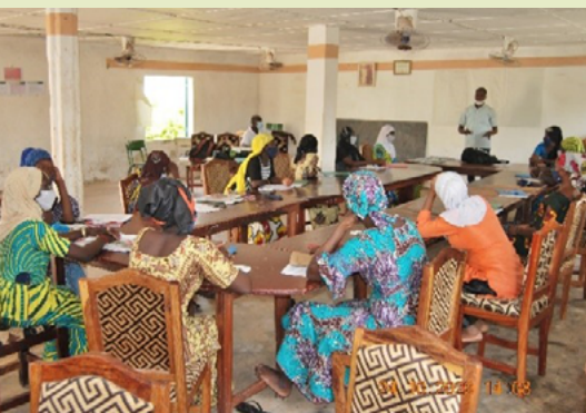
Figure 1: Atelier sur les méthodes et outils de recherche au Mali