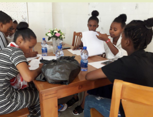
Figure 2 : Discussion préalable à la collecte de données en Ethiopie