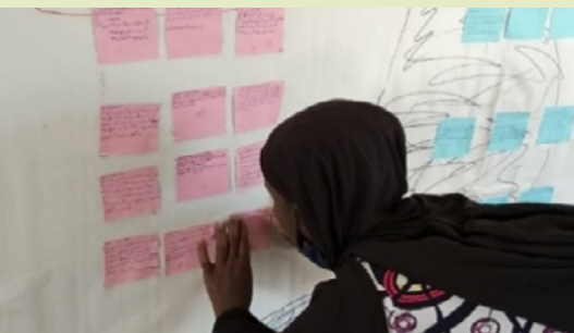
Figure 4 : Processus d'analyse des données au Mali